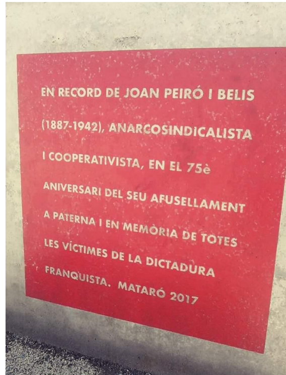
Dedicatòria en el monument dedicat a Joan Peiró a Mataró

Coneixem el posicionament de Joan Peiró respecte del Pacte Germanosoviètic en un article que publicà a El Poble Català , de París, el 3 de novembre de 1939. Una