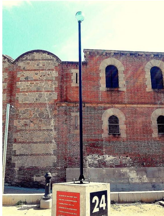
Monument dedicat a Joan Peiró a Mataró

El Progreso era el portaveu periodístic de la lògia maçònica Faro de Iluro, definint-se la publicació com a republicana progressista, maçona i lliurepensadora.