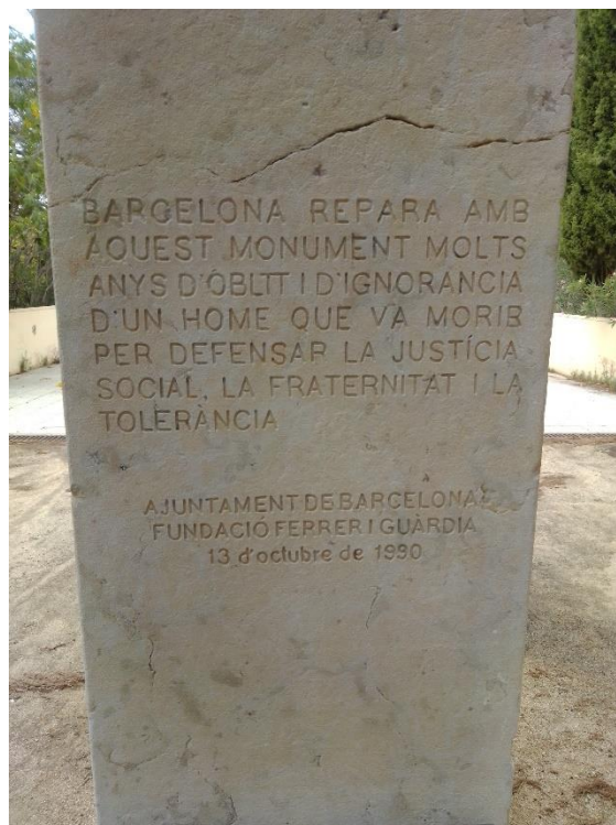
Dedicatòria en el monument a Ferrer i Guardia a Barcelona