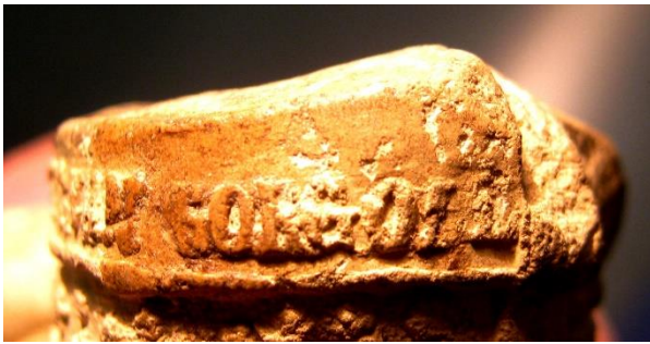
Fig. 2: detall de la signatura de la corona a la part frontal.