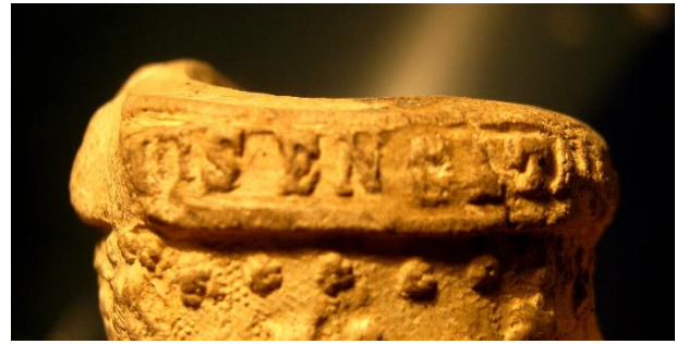
Fig. 3: detall de la signatura de la corona al costat esquerra

«PALAMOS CATALUÑA FA(brica) DE JUAN CASTELLA».