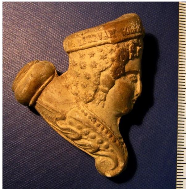
Fig. 1: imatge del costat dret de la pipa.

El fabricant «ESTEVAN GOLGOLL» creiem que s'hauria de relacionar, amb la marca