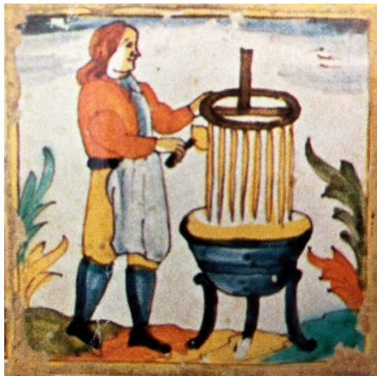
Rajola catalana d'oficis amb la imatge d'un cerer, conservada al Museu d'Història de la Ciutat de Barcelona.

ens explica en bona part el funcionament i estructura del gremi a la ciutat de Mataró. També, inusualment, la norma fa menció expressa d'aquelles persones que governaven el gremi amb la qual cosa podem efectuar un contrast de dades per esbrinar la posició de cada un d'ells en la societat mataronina d'aquell moment.