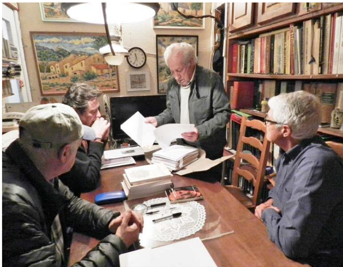
El dia 21 de març de 2017 recopilant material per al seu llibre Dues viles i una ciutat. Tot fent memòria